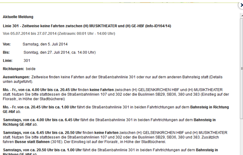
Abb. 2: Beispiel für den Inhalt einer ICS-Meldung

Bei größeren, flächendeckenden Beeinträchtigungen steht zudem die Möglichkeit zur Schal- tung einer sogenannten „Bannermeldung“ im Auskunftssystem zur Verfügung. Diese er- scheint als „Störer“ bei jeder gerechneten Auskunft und wird eingesetzt, um bei großen Stö- rungen mit verbund- oder sogar landesweiten Auswirkungen die Fahrgäste auf eine Aus- nahmesituation aufmerksam zu machen.